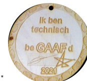
voorbeeld uit hout gesneden:

Het winnende bord wordt 2 x gelaserd met je naam erop 1 voor Techno Promo en 1 voor je slaapkamer.